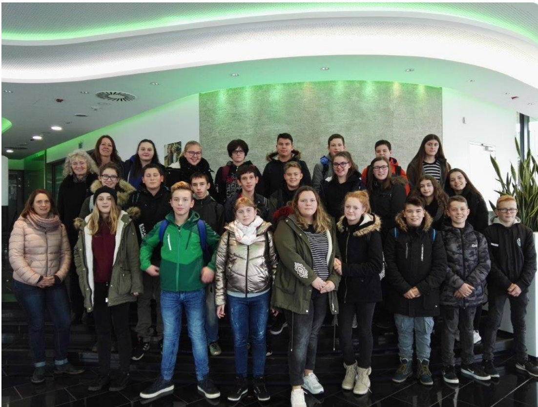
(das Bild zeigt die Schülerinnen und Schüler nach der Betriebserkundung)

Seit fünf Jahren besteht in Höchstädt eine sehr intensive und lebendige Schulpartnerschaft der Mittelschule mit der Firma Grünbeck Wasseraufbereitung GmbH. Ziel dieser Kooperation ist es vor allem, den Schülerinnen und Schülern mehr Sicherheit bei ihrer Berufswahl zu geben.